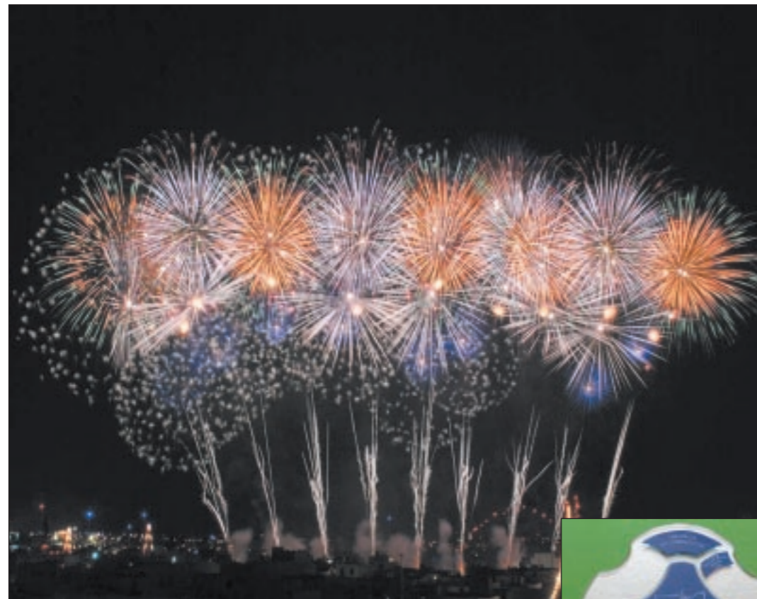
L-Għaqda tan-Nar Santa Marija tal-Imqabba rebhet l-ewwel kampjonat Malti tal-logħob tan-nar li sar fil-Port il-Kbir fl-2006. F'dan il-kampjonat, l-Għaqda Mqabbija kkompetiet ma' diversi għaqdiet tan-nar Maltin u internazzjonali u niżżlet isimha bhala l-ewwel rebbieha ta' dan il-kampjonat