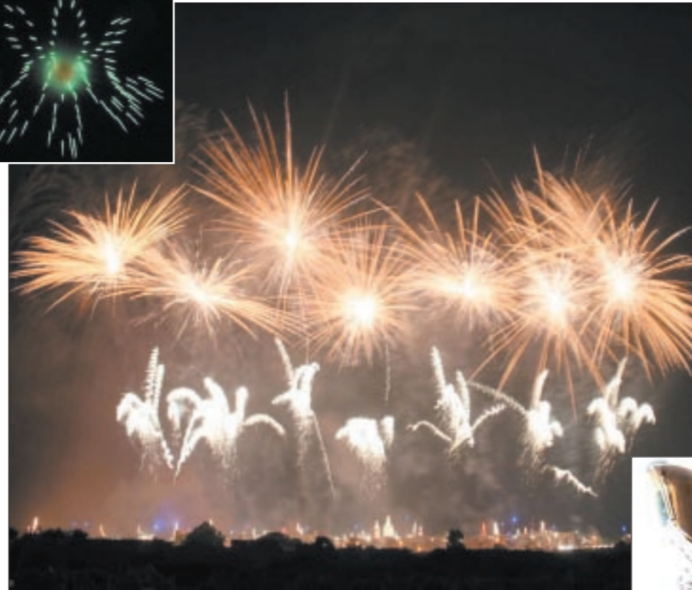
L-Għaqda tan-Nar Santa Marija tal-Imqabba rebhet il-kampjonat dinji tal-logħob tan-nar - bit-titlu 'Caput Lucis' - f'Ruma, l-Italja, fl-2007. Hi kkompetiet ma' għaqdiet tan-nar mill-Italja, mill-Ingilterra, minn Spanja, mis-Slovenja, mir-Rumanija, mill-Gappun u miċ-Cina. Il-miġja tat-trofej tal-kampjonat dinji f'Malta u fl-Imqabba fis-6 t'Awwissu 2007 kienet festegġjata kif jirraġuna