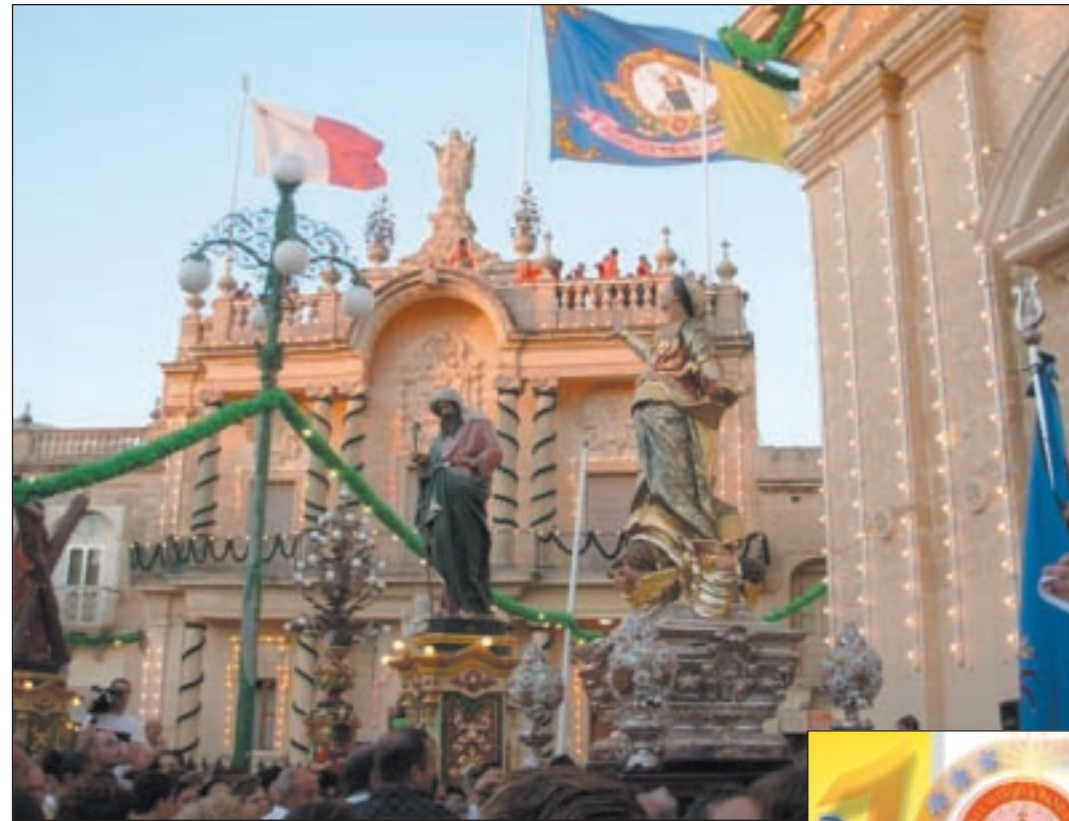
Is-Socjetà Santa Marija tal-Imqabba twaqqfet fl-1910 bl-isem 'King George V' ghar-Re li kien għadu kemm tela' fuq it-tron f'Mejju ta' dik l-istess sena. Is-Socjetà twaqqfet biex tiċcelebra l-festa ta' Santa Marija, patruna tal-Imqabba, u tgħallim il-mużika. Fir-ritratt tidher l-istatwa ta' Santa Marija fuq iz-zuntier milqugha mill-Banda Re Gorg V. Fl-isfond tidher is-sede tas-Socjetà Santa Marija li aktar tard din is-sena se żżanzan estensjoni maġenbha fuq il-lemin