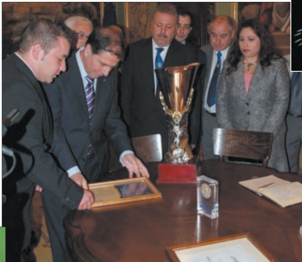
Il-President George Abela jidher waqt żjara fis-sede tas-Socjetà Santa Marija tal-Imqabba fi Frar hu u jara mill-qrib il-premju tal-Unjoni Ewropea għall-ġemellaġġi 'Stile tad-Deheb għall-Ġemellaġġi' li s-Socjetà Santa Marija tal-Imqabba rebhet fl-1998 għall-ġemellaġġ li għamlet mal-banda Taljana ta' Santa Vittoria in Matenano f'Ascoli Piceno